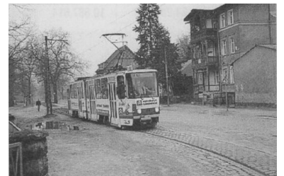
Tatra aus Cottbus in der Schöneicher Dorfstraße. (Foto: A. Neumann, 1994)