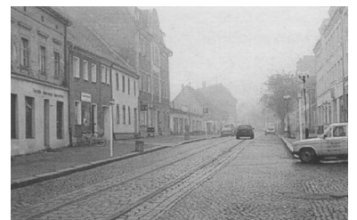
Künftige Tram-Endstelle Große Straße/Ecke Klosterstraße in Strausberg?