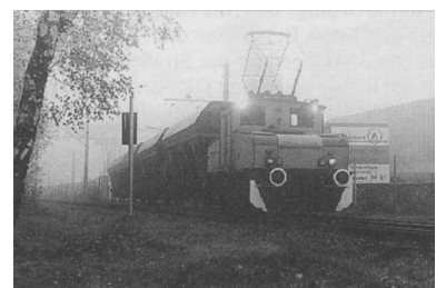
Güterverkehr auf der Strausberger Eisenbahn.