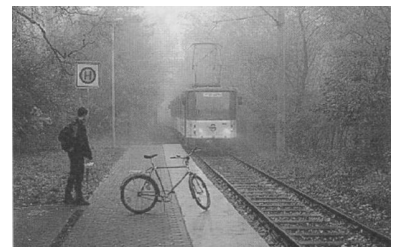
Sogar Fahrräder werden in Strausberg mit der Tram befördert. (Foto: I. Köhler, 1995)