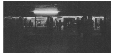
Labyrinth? Katakombe? - Zwischengeschoss im Berliner U-Bahnhof Alexanderplatz