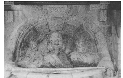
U-Bahn, Mythen und Dämonen: Der Nickelmännchen-Brunnen von Westphal unter der Hochbahnrampe der Berliner U-Bahnhofs Nollendorfplatz.