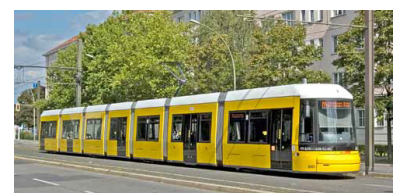
Eine 40 m lange BVG-Straßenbahn vom Typ Flexity Berlin. Davon gibts bald mehr