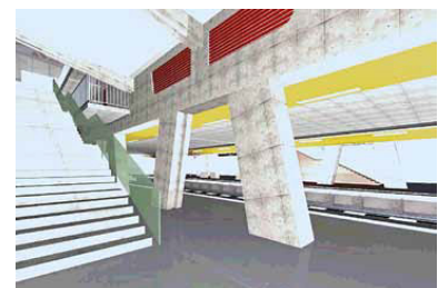
Die Situation unter dem neuen Gebäude auf dem S-Bahnsteig.