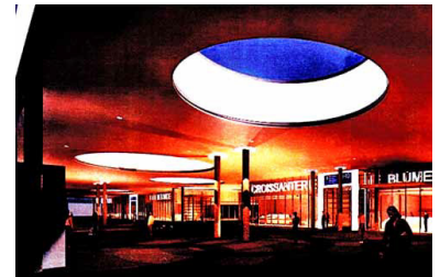
Der Durchgang zwischen den beiden Bauteilen zu den Bahnsteigabgängen. Das Dach ist mit großen Öffnungen zum Lichteinfall versehen. (Simulation: DB AG)