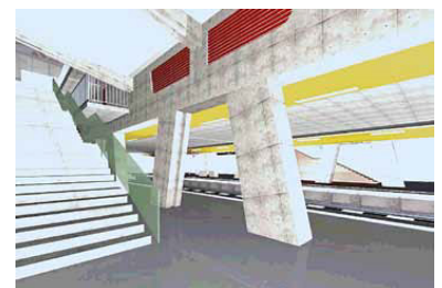
Die Situation unter dem neuen Gebäude auf dem S-Bahnsteig. (Simulation: DB AG)