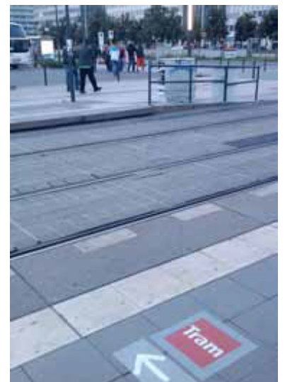
Straßenbahn-Haltestelle U Alexanderplatz. Im Hintergrund die nachträglich eingeführte und sofort angenommene SEV-Haltestelle. Die kaum erkennbare Wegeleitung (grau auf grau) zur Haltestelle Memhardstr. wurde daran nicht angepasst, aber wohl so interpretiert. Warum gab es keine gelben Fußtapsen, wie sie bei der U-Bahn inzwischen üblich sind?