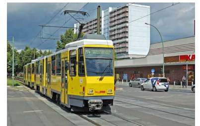
Ein Zug der Linie M 4, beschildert mit dem Endziel Prenzlauer Berg, Arnswalder Platz wo er auch hinfuhr. Leider schilderten dies nur wenige Züge.