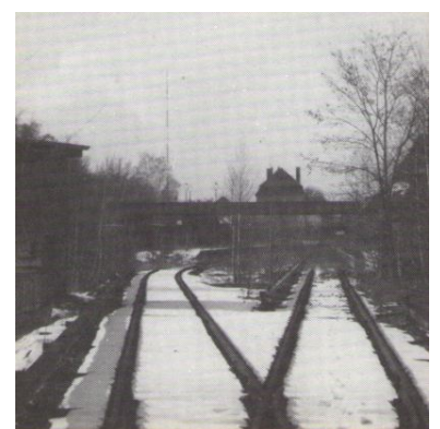
Spandauer Vorortstrecke (S-Bahnhof Olympiastadion, 4/88)