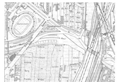
Der Kartenausschnitt zeigt im Maßstab 1:6000 den Bereich des vorgesehenen Autobahn-Durchbruches südlich de S-Bf.s Papestraße (Karte: SenBauWohn)