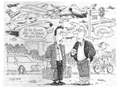
aus: die Tageszeitung, 8. April 1989