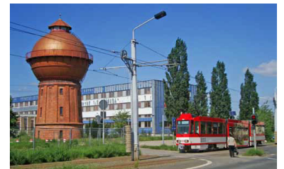
Als die Straßenbahn noch zur Jessener Straße fuhr, hier hinter dem Hauptbahnhof am restaurierten Wasserturm. Ob die Tram wiederkehrt? (Foto: Florian Müller, Juni 2010)

In der Begründung zum Beschluss wird ausgeführt: »Da aus heutiger Sicht der dauerhafte Bestand der Gleisanlage in der Vetschauer Str./Richtung Jessener Str. nicht gesichert ist, muss die Vorzugsvariante so weiter geplant werden, dass der betreffende Gleisanschluss nur optional Berücksichtigung findet. Diese Vorgehensweise stellt sicher, dass ausschließlich verkehrlich begründete und notwendige Infrastruktur geplant und gebaut wird. Die verkehrliche Bedeutung des Gleisanschlusses ist direkt