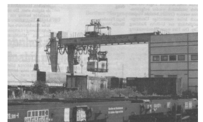
Umschlagkran auf dem Containerbahnhof