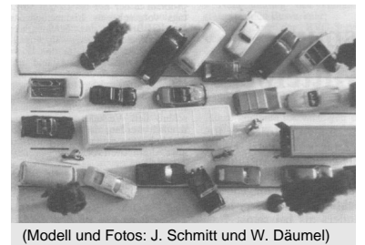
(Modell und Fotos: J. Schmitt und W. Däumel)

Zwei Tage später war dann das vom Charlottenburger Baustadtrat Dyckhoff (SPD) initiierte "Charlottenburger Stadtgespräch" diesmal ebenfalls dem Thema Busspuren auf dem Ku'damm gewidmet. zahlreiche Bürger, Verbandsvertreter und Politiker Eillten den großen Saal im Rathaus. Vorgestellt wurden hier nochmals die verschiedenen Lösungsmöglichkeiten. Bei der anschließenden Plenums- und Publikumsdiskussion wurde deutlich, daß auch hier niemand die konventionelle Busspurlösung am Ku'damm für zweckmälg hält. Ein beachtenswerter Beitrag kam vom BVG-Direktor Lorenzen, der erläuterte, daß für die BVG auch andere Lösungen als die heftig vom Vertreter der Senatsverkehrsverwaltung, Herrn Gerdum, verteidigte