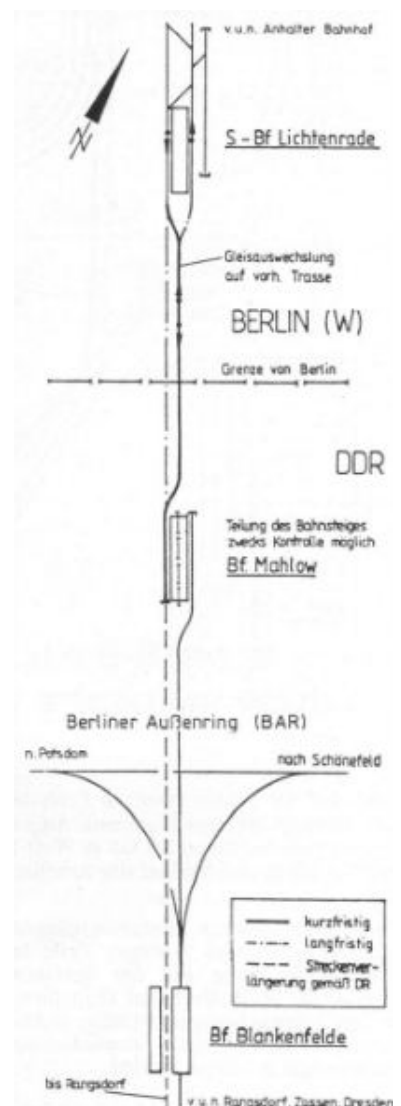
5,7 km lang ist die Strecke von Lichtenrade bis Blankenfelde. 1,2 km davon liegen in West-Berlin. Die Rodungsarbeiten haben bereits begonnen. Ab Mai 1990 sollen die Erdarbeiten folgen, und Ende 1991 könnten die ersten S-Bahn-Züge wieder fahren. (Zeichnung: SenArbVuB III)