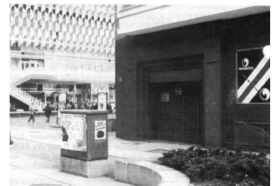
Am Alexanderplatz. Dieser Abgang zur U-Bahn-Linie 8 wurde in ein in den 30er Jahren errichtetes Geschäftshaus integriert (Architekt: Peter Behrens). Doch seit 1961 ist der Zugang verschlossen, die BVG-Züge durchfahren den Ost-Berliner Bahnhof ohne Halt. Die IGEB fordert wegen des zu erwartenden Fahrgastandrangs eine Öffnung zum 2. Juli.

Inzwischen gibt es erste positive Ergebnisse. So soll der durchgehende S-Bahn-Verkehr auf der Stadtbahn frühestens zum 15. Juni, spätestens aber zum 2. Juli eingerichtet werden. Getrübt wird diese erfreuliche Meldung aber durch Äußerungen, nur alle 20 Minuten einen Zug durchfahren lassen zu wollen. Dies zeigt, daß die Verantwortlichen den Ernst der Lage noch immer nicht erkannt haben, denn insbesondere freitags und sonnabends ist die Situation auf der Stadtbahn zwischen Friedrichstraße und Zoo schon jetzt unerträglich. Immer wieder kommen einzelne Fahrgäste nicht mehr in die überfüllten Züge, und das Zusteigen dauert oft so lange,