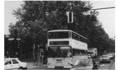
Erfolgreich: Die Kudamm-Busspur

Die Linie 19 - zusammen mit den Omnibuslinien 29 und 69 Bestandteil des Ku'damm-Konzeptes - ist eine ausgesprochene Touristenlinie mit einem entsprechend