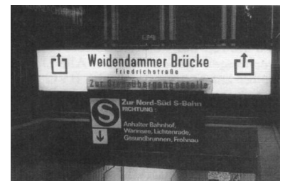
Bf. Friedrichstraße. Zugänge zum Nord-Süd-Bahnsteig, wo die Züge der BVG-Linie S1 abfahren, vor und am 1. Juli. Neue Hinweise wurden erforderlich, alte - Zur Grenzübergangsstelle - entbehrlich.