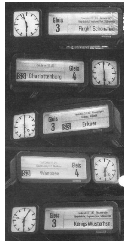
Am 2. Juli morgens auf dem Lehrter Stadtbahnhof.

Auch die Potsdamer und Wannseer mußten für die Neuerung einen Preis zahlen, denn sie büßten den zuverlässigen 10-Minuten-Takt zugunsten eines 12/8-Minuten-Taktes mit noch einigen Störungen ein. Doch die Verbesserungen überwiegen, nicht nur, weil