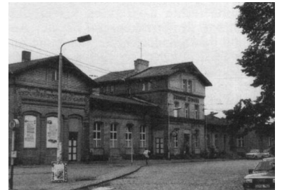
Die Nahverkehrszüge zwischen Belzig (Foto oben) und Drewitz (Foto unten) sollen zur besseren Übersichtlichkeit des Angebotes im Berliner Umgang als R-Bahn bezeichnet und mit einer Liniennummer versehen werden.