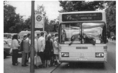
Während der alle 20 Minuten fahrende Airport-Express oft ohne jeden Fahrgast verkehrt (auch diese Frau stieg gleich wieder aus, als sie den Fahrpreis erfuhr), müssen sich die vielen Fahrgäste des 75ers mit einem 30- bis 90-Minutentakt zwischen Berlin-Lichtenrade und Blankenfelde begnügen.