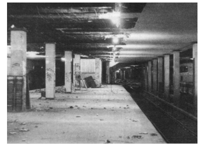
S-Bf. Potsdamer Platz. Die Sanierungsarbeiten im Nord-Süd-Tunnel haben begonnen. Durch eine ungeschickte Fahrplangestaltung bekommen das sehr viel mehr Fahrgäste als erforderlich zu spüren.

Im oben rechts abgebildeten Minutenplan für die Zeit 1.91 bis 2.91 fahren die Züge von Frohnau bis Humboldtthain und zurück über den Gleiswechsel südlich von Gesundbrunnen nach Frohnau zu den planmäßigen Zeiten. Im unteren Minutenplan für die Zeit 2.91 bis 3.91 fahren die Züge von Lichtenrade über Anhalter Bahnhof (Gleis 4) nach Friedrichstraße und zurück auf dem falschen Gleis bis Anhalter Bahnhof (Gleis 3). Die nächste Pendelfahrt übernimmt der nächste Zug aus Lichtenrade. Außerdem warten die Züge von Frohnau in Bornholmer Straße zwei Minuten, bis der Zug Richtung Frohnau in Gesundbrunnen Gleis 1 geräumt hat. Die von Lichtenrade nach Friedrichstraße durchfahrenden Züge sind keine Bedingung für das Funktionieren des Minutenplans, erleichtern aber in der Praxis die Einhaltung des