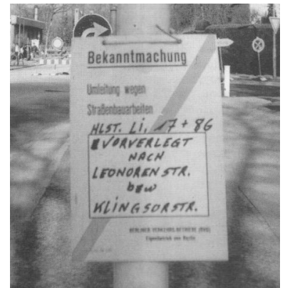
Wer diese Haltestelle erreicht hatte, durfte noch einen Kilometer laufen. Bei Ortsunkundigen dürfte es auch 'mal mehr geworden sein.

Abgesehen von den Informationsmängeln. Auch in diesem Fall war es unzumutbar und auch unnötig den Busverkehr so weiträumig umzuleiten. Völlig problemlos hätte die Buslinie 86 über die Bäkestraße geführt werden können, wodurch zwar immer noch eine große, aber nicht mehr ganz so riesige Erschließungslücke verblieben wäre. Und daß der 17er, der ja nicht nur den Ostpreußendamm, sondern auch die Königsberger Straße nicht mehr bedient hat, nicht die Pkw-Umleitung benutzte, womit er alle seine Haltestellen hätte bedienen können, ist unbegreiflich. Das Argument