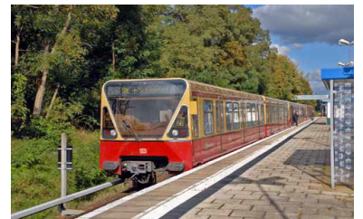
S-Bahn-Zug der Baureihe 480. Diese Züge und die der Baureihe 485 sollen nach bisheriger Planung Ende 2017 aus dem Betrieb genommen werden. Da der Ersatz durch Neubaufahrzeuge aber 2018 noch nicht möglich sein wird, werden die Möglichkeiten einer erneuten Aufarbeitung geprüft. Dann würden diese Züge allerdings 2016/17 zeitweise aus dem Verkehr genommen werden müssen. Die nächste Fahrzeugknappheit ist also heute schon vorprogrammiert.

Zusammen mit der Firma Knorr-Bremse hat die S-Bahn eine automatische Funktionsüberwachung (basierend auf Magneten) und ein Beheizungssystem für die Besandungsanlagen entwickelt und eingebaut. Die Baureihe 480 soll eine Adaption davon noch zum Winter 2012 erhalten. Die Baureihe 485 kommt bekanntermaßen ohne Sand aus. Die Bremsanlage der Baureihe 481 wird weiter optimiert, dies trifft vor allem auf den Gleitschutz zu. Dies soll bis zum Dezember dieses Jahres geschehen.