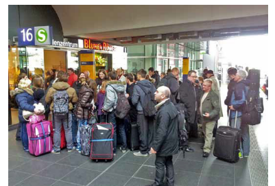
Überlastetes S-Bahn-Kundenzentrum im Berliner Hauptbahnhof. Automaten können den personalbedienten Verkauf ergänzen, aber nicht ersetzen - schon gar nicht auf Stationen mit einem hohen Anteil von Gelegenheitskunden. Und dazu zählen Touristen fast immer.