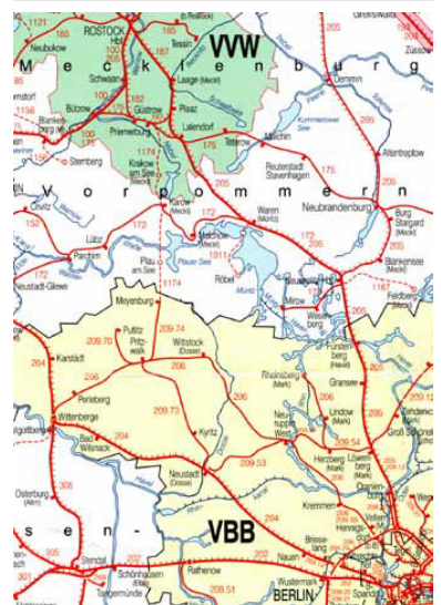
Die Prignitz, eine ländlich geprägte und wirtschaftlich schwache Region im Nordwesten Brandenburgs, konnte bisher ihre Eisenbahn erhalten. Auf der verkehrlich interessanten Strecke Meyenburg--Plau--Karow--Güstrow wurde der Personenverkehr vom Land Mecklenburg-Vorpommern bereits abbestellt. (Karte: DB Kursbuchkarte Mai 2006)