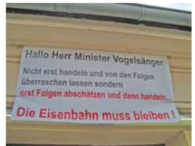
Der Protest kommt aus der Region. Plakat am Empfangsgebäude des Bahnhofs Pritzwalk. Außerdem engagieren sich die Bürger und Bürgermeister der anliegenden Orte politisch, finanziell und durch Protestfahrten und Postkartenaktionen.