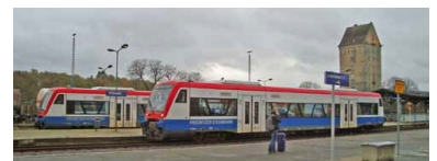
Bahnhof Pritzwalk, Knotenpunkt in der Prignitz. Noch sind es fünf Streckenäste, die hier zusammenkommen, doch drei davon stehen auf der Kippe, auch wenn sie jetzt nochmals zwei Jahre Galgenfrist bekommen haben. Hier stehen die Regio-Shuttle der Prignitzer Eisenbahn zur Abfahrt bereit nach Neustadt (Dosse) und nach Meyenburg.