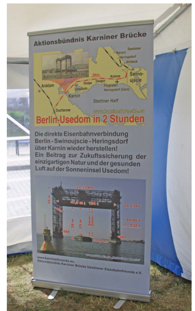
Das Aktionsbündnis wirbt auf großen Stellwänden für seine Ziele.