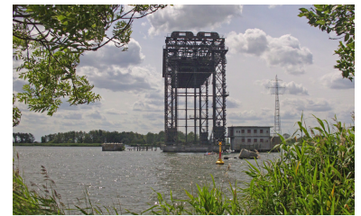
Die Ruine der Hubbrücke bei Karnin erinnert an die einstige Strecke.

Das Aktionsbündnis setzt auf die Unterstützung aus den Ländern Polen und Deutschland, denn dies ist ein europäisches Projekt mit strukturpolitischer Bedeutung für die binationale Insel Usedom und die deutsch-polnische Grenzregion. So unterstützt die Stadt Swinoujscie das Projekt ebenso wie die Regierungen der Bundesländer Mecklenburg-Vorpommern, Brandenburg und Berlin. Verkehrsminister Volker Schlotmann organisierte beispielsweise 2010 eine Fachtagung in Anklam, auf der sich alle im Schweriner Landtag vertretenen Fraktionen für die Bahnlinie