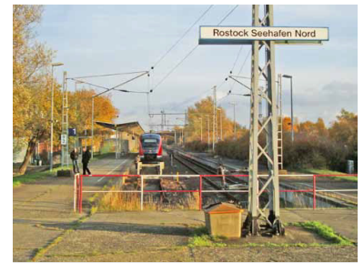
Den langen Bahnsteigen in Rostock Seehafen Nord sieht man an, dass sie einst für lange Züge ausgelegt wurden. Von hier ist noch ein ca. 700 Meter langer ungemütlicher Fußweg zum Passagierterminal der Fähren zurückzulegen. (Foto: Florian Müller (Nov. 2012))

Doch das Potenzial der Bahn als Zubringer zu den Fähren wurde nie abgerufen. Ein Grund liegt darin, dass der Haltepunkt Seehafen Nord etwa 700 Meter vom Fährterminal entfernt liegt, und der Weg durch das unwirtliche Hafengelände kaum Reisende anlockt, schon gar nicht mit schwerem Gepäck. Von Anfang an wurden Stimmen laut, das Terminal direkt an die S-Bahn anzubinden. Tatsächlich wurden Ende der 1990er Jahre dorthin Gleise verlegt, die jedoch niemals planmäßige Personenzüge sahen. Zunächst wurde auf die fehlende Elektrifizierung verwiesen. Seit 2003 wird die S-Bahn-Linie allerdings in Rostock Hauptbahnhof gebrochen. Zum Seehafen pendeln seitdem Dieseltriebwagen, die für die geringe Nachfrage ausreichen. Doch auch diese fahren nur den alten Streckenendpunkt am Eingang des Hafens an.