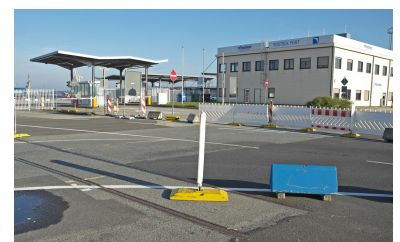
Hier sollten einmal S-Bahnen zur Fähre fahren. Einige Gleisreste vor dem Terminal liegen noch im Asphalt.