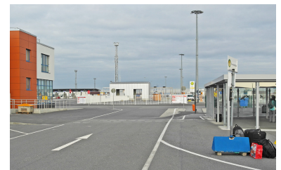
Die große Buswartehalle (rechts) am Terminal dient nur den Shuttlebussen zur Fähre. Die Stadtbusse fahren auf der anderen Seite des Vorplatzes ab.