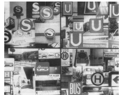
Die Produktsignets heute: eine verwirrende Vielfalt.

Die schnelle Harmonisierung von Fahrgastinformation und -lenkung war also dringend notwendig für einen gemeinsamen Nahverkehr in der Region Berlin. Für diese Harmonisierung mußten einige Grundelemente zwischen den Verkehrsträgern abgestimmt und schließlich festgelegt werden: - Einheitliche Grundelemente, z.B. Betriebsteilzeichen, Betriebsteilfarben, einheitliche Schrift; Einheitliches Liniennummerierungssystem; Abgestimmtes Fahrplanbuchsystem; Einheitliche Pläne, z.B. Schnellbahnspinne, Liniengesamtnetz, Stadtteilkarten, Nachtnetz; Einheitliches Fahrgastleitsystem.