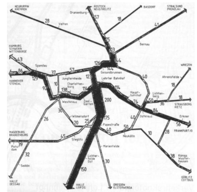
Angenommene Streckenbelastung im Stadtgebiet durch den Personenfern- und Regionalverkehr. (Abbildung: DE-Consult)

Um so erstaunlicher ist es, daß - allem Anschein nach - die Stadtentwicklungspolitik das zukunftsweisende Feld der Netzgestaltung und Bahnhofsplanung den Verkehrsplanern überläßt und bereit ist, die Ergebnisse als Vorgaben der städtebaulichen Entwicklung zu akzeptieren. Mangels alternativer Konzepte und