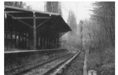
S-Bf. Reinickendorf. Alle Stationen zwischen Schönholz und Tegel sind noch in recht gutem Zustand.