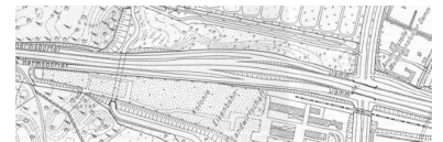
Im Norden von Berlin-Tegel wurde die Autobahn auf die Kremmener Bahn gebaut. Zwischen dem Hermsdofer und dem Waidmannsluster Damm müssen deshalb jetzt einige Kleingärten beseitigt werden, um die S-S-Bahn-Strecke zwischen Tegel und Schulzendorf wiederherstellen zu können. Die betroffenen Kleingärten liegen allerdings alle auf Bahngelände.