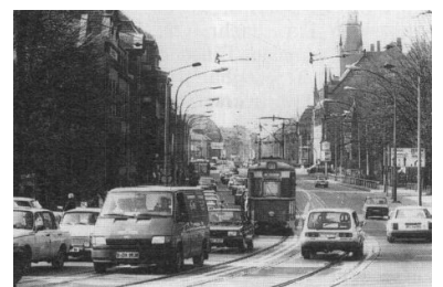
Behinderungen der Straßenbahn in der Köpenicker Dammvorstadt, die oft schon durch kleine Maßnahmen vermeidbar wären. Doch einige Senats- und Bezirksplaner denken lieber über Straßenbahn-Stilllegungen nach. Auf den ersten drei Bildern sind alltägliche Situationen in der Bahnhofstraße zu sehen. Das Bild rechts unten zeigt die regelmäßige Behinderung der Straßenbahn auf der Dammbrücke bei der Fahrt in Richtung Altstadt.