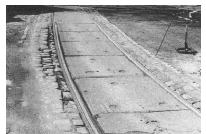
Hönower Straße. Die Fahrbahn wurde instandgesetzt, die Straßenbahnstrecke blieb in katastrophalem Zustand: Abgesackte Randpflasterung, hohlliegende Gleise, verriffelte Schienenköpfe.