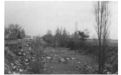
An vielen Stellen in Teltow und Stahnsdorf ist die für die S-Bahn freigehaltene Trasse heute noch gut zu erkennen. Das untere Bild zeigt der Bereich des geplanten S-Bahnhofes Teltow Stadt, das obere die Trasse durch Stahnsdorf.