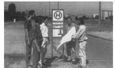
Anlaßig der Vorstellung des Konzeptes der Berliner AG Straßenbahn wurde zur Unterstreichung der Ausbauforderungen symbolisch eine Straßenbahn-Haltestelle am Potsdamer Platz eingeweiht.

Die Fahrzeug- und Gleisbautechniker haben die moderne Straßenbahn inzwischen so leise gemacht, daß sie auch auf diesem Gebiet nur noch das Fahrrad als Konkurrent fürchten muß. Insbesondere durch Einbau von Kunststoffschichten unter den Schienen und unter den Schwellen fahren in zahlreichen Städten die Straßenbahnen auch erschütterungsfrei durch dicht bebaute historische Ortskerne.