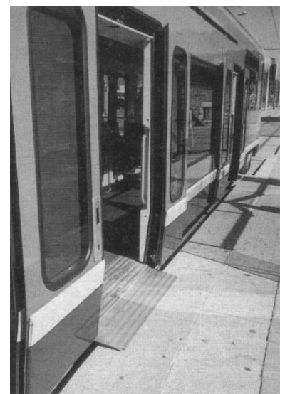
Die Niederflurwagen in Grenoble ermöglicht einen ebenerdigen und lückenlosen Einstieg, von dem nicht nur Rollstuhlfahrer, die ohne fremde Hilfe das Fahrzeug nutzen können, sondern auch alle anderen Fahrgäste profitieren.