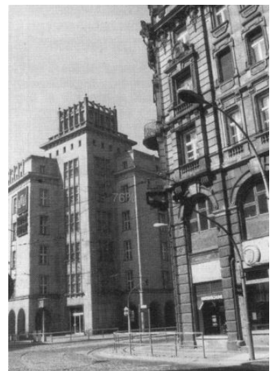
Invalidenstraße Ecke Chausseestraße. Das rechte, denkmalwerte Haus dürfte für Straßenverbreiterungspläne ein schwer zu überwindendes Hindernis sein. Deshalb kann die vom Senator angestrebte Verbesserung für den Autoverkehr nur mit einer Beseitigung der Straßenbahn erreicht werden.