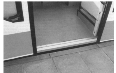
Einstieg in den Bremer Niederflur-Straßenbahnwagen. Die Entscheidung für das Bremer Fahrzeug ist richtig. Allerdings sollten keinesfalls 27 m lange Fahrzeuge bestellt werden, da diese für die in Berlin vorhandenen 50 m langen Haltestellen zu kurz bzw. bei Doppeltraktion zu lang sind.

Nun noch zwei Hinweise zur weiteren Lektüre: Um die Zitate aus der Arbeit des Verkehrssenators von den Bewertungen der IGEB eindeutig unterscheiden zu können, sind alle Zitate in Normalschrift und alle Bewertungen kursiv gesetzt. Das Ziel der Eindeutigkeit ist ferner der Grund, daß nachfolgend, auch in den Zitaten, der Begriff «Straßenbahn» und nicht der vom Senat gebrauchte Begriff "Stadtbahn" benutzt wurde. Der Begriff "Stadtbahn" ist in Berlin für die berühmte, über 100 Jahre alte Eisenbahnstrecke quer durch die Berliner Innenstadt vergeben.