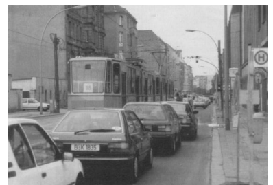
Chausseestraße nördlich der Invalidenstraße. Aufgabe bzw. Erhalt noch offen stehen in Verkehrssenator Haases Konzept über diesen Streckenabschnitt. Noch schlechter sieht es für den Abschnitt südlich der Invalidenstraße aus: Er soll stillgelegt werden.