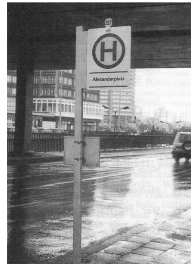
Eine der wenig spektakulären und doch so wichtigen Verbesserungen: 1991 erreichte die IGEB u.a. die Einrichtung dieser Haltestelle für den Bus 257 am S-Bf. Alexanderplatz, womit der Fußweg für Umsteiger zur S-Bahn verkürzt wurde.

Ein gravierendes, von vielen Einsendern immer wieder angesprochenes Thema ist die