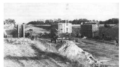
Autobrücke über die Dresdener Bahn bei Mahlow. Diesen Straßenbauarbeiten haben es die Reisenden zu verdanken, daß der Wiederinbetriebnahmetermin für die S-Bahn zwischen Lichtenrade und Blankenfelde vom 1.5. über den 15.7. nun auf den 1.9.92 verschoben wurde.