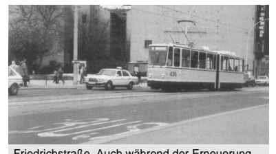
Friedrichstraße. Auch während der Erneuerung der Weidendammer Brücke könnte hier die Straßenbahn fahren. Zwar ist die Wendeschleife am Kupfergraben nicht erreichbar, aber der Einsatz der vorhandenen Zweirichtungsfahrzeuge würde ein Enden auf der Friedrichstraße ohne Wendeschleife ermöglichen.