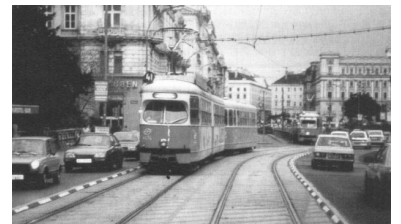
Währinger Straße in Wien. So einfach und preiswert ist es, das Gleis der Tram freizuhalten. Im Notfall können die Schwellen von den Autos überfahren werden. Solche oder ähnliche Lösungen findet man in vielen Städten - ausgenommen Berlin.