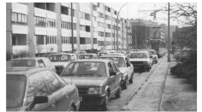
Möllendorffstraße in Berlin. Die Straßenbahn steht im Autostau. Solche Mißstände findet man in vielen Straßen der Stadt. Durch Freihaltung der Gleise wären bei der BVG 20 bis 30 Mio DM im Jahr einzusparen.

Allein 1991 sind 20 neue Lichtsignalanlagen an Kreuzungen bzw. Einmündungen gebaut worden, die von Tramlinien befahren werden. Bei keiner Ampel hat die Tram eine Vorrangschaltung erhalten. Im Gegenteil: Häufig hat die Tram nur 8 bis 10 s grün