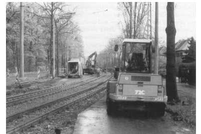
Gleisbauarbeiten in der Nähe der Endstelle am S-Bf. Friedrichshagen