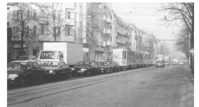
Die von der BVG geplante Neustrukturierung und die Neunummerierung des Berliner Tramnetzes sind richtig, aber nicht ausreichend. Hier ist aber weniger die BVG, sondern vor allem der Verkehrssenator gefordert. Doch unter Herrn Haases Regie kommt die Straßenbahnplanung noch schlechter voran, als dieser Zug auf der Prenzlauer Promenade.

Beispiel: Auf der Prenzlauer Allee gab es bisher die Linien 20,71 und 72, künftig fährt nur noch eine Linie. Wenn diese Linie weiter 71 heißt, wird sie weiter mit ihrem heutigen Profil ("manchmal alle 15, meistens aber nur alle 20 Minuten") in