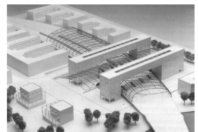
Modelle des geplanten Lehrter Bahnhofs, oben der Entwurf aus dem Büro des Berliner Architekten Kleihues, rechts der von der Verwaltung bevorzugte Entwurf aus dem Hamburger Architekturbüro Von Gerkan, Marg und Partner. Wirklich befriedigen kann aber auch dieser Entwurf nicht. Für solch ein bedeutendes Bauwerk hätte es einen richtigen Wettbewerb geben müssen.