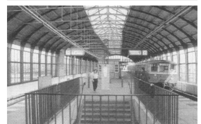
Lehrter Stadtbahnhof. In der offiziellen Information Nr. 1 zur Planung der Verkehrsanlagen im Zentralen Bereich (Stand Oktober 1992) wird noch mit diesem Bild für die Berliner S-Bahn geworben. Doch gleichzeitig wurde schon an den Plänen gearbeitet, die jetzt eine vollständige Beseitigung des historischen Stadtbahnviadukts zwischen der Straße Alt-Moabit und der Charité einschließlich Lehrter Stadtbahnhof und Brücke über den Humboldthafen vorsehen.