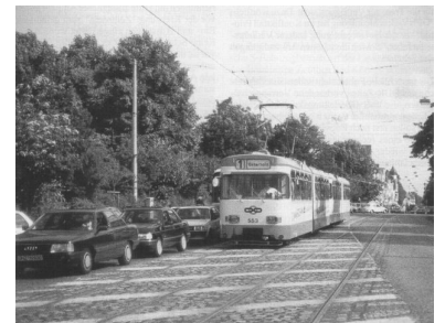
Deutlich erkennbare Gleisabmarkierungen wie hier in Bremen werden auch von Autofahrern akzeptiert und räumen der Tram Vorrang ein. In Berlin dagegen sind die ohnehin zu wenigen Abmarkierungen oft kaum noch zu erkennen.