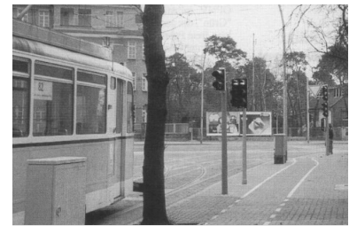
Auch an der Kreuzung Ehrlichstraße Ecke Treskowallee wurde eine neue Anforderungsschaltung installiert, die der Tram jedoch statt Vorrang nur Nachteile bringt

Aber auch die "normalen" Ampelanlagen ohne Straßenbahnbeeinflussung werden zum Verkehrshindernis, wenn sich linksabbiegende Fahrzeuge vor der Tram auf dem Gleiskörper einordnen dürfen. Am Mandrellaplatz in Köpenick, wo eine Ampel neu aufgestellt wurde, können pro Umlauf höchstens drei Linksabbieger die Kreuzung