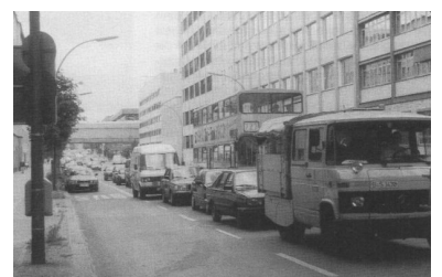
Busspuren in Berlin: Dort, wo sie besonders gebraucht werden, enden sie! Ein Beispiel dafür ist die neu angelegte Busspur in der Fennstraße, die 150 m vor der Kreuzung Müllerstraße endet.