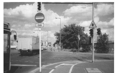
Während in anderen Städten dem ÖPNV durch besondere Ampelschaltungen Vorrang eingeräumt wird, werden in Berlin die Busse und Straßenbahnen durch Ampeln zusätzlich schikaniert. Ein besonders beeindruckendes Beispiel gibt es am Potsdamer Platz, wo zunächst der Individualverkehr Richtung Leipziger Straße fahren darf und erst anschließend, wenn die Straße zugestaut ist, der Bus für wenige Sekunden freie Fahrt erhält.