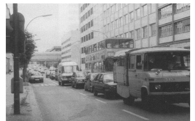
Busspuren in Berlin: Dort, wo sie besonders gebraucht werden, enden sie! Ein Beispiel dafür ist die neu angelegte Busspur in der Fennstraße, die 150 m vor der Kreuzung Müllerstraße endet.