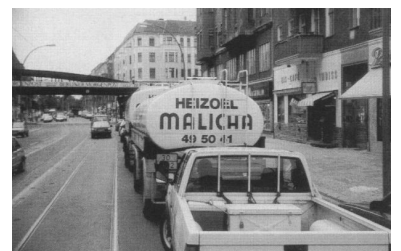
Blick aus der Tram auf eine alltägliche Stauszene in der Dimitroffstraße: Das Fehlen der Gleis-Abmarkierung bedeutet für die Tram zusätzliche Fahrzeit und damit zusätzliche Kosten.