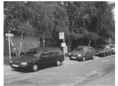
Zugeparkte Tram- und Bushaltestellen sind in vielen Gegenden Berlins bereits zum Normalzustand geworden.