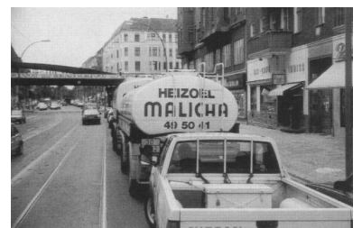
Blick aus der Tram auf eine alltägliche Stauszene in der Dimitroffstraße: Das Fehlen der Gleis-Abmarkierung bedeutet für die Tram zusätzliche Fahrzeit und damit zusätzliche Kosten.