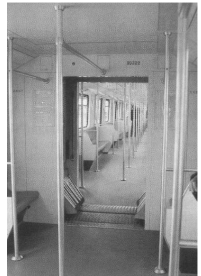
Blick durch den Zug, oben der BVG-Versuchszug, hier ein U-Bahn-Zug für Shanghai. Der Übergang zwischen den beiden Wagen ist beim BVG-Zug nicht nur deutlich großzügiger gestaltet, sondern er ist auch für seh- und für gehbehinderte Fahrgäste sehr viel sicherer.