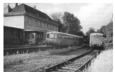
Endstation Liebenwalde. Zum kleinen Fahrplanwechsel Ende September sollte der Westast der Heidekrautbahn, die Strecke zwischen Basdorf und Liebenwalde stillgelegt werden. Durch Proteste und eine breite Berichterstattung in den Medien konnte die Stilllegung abgewendet werden - vorerst.