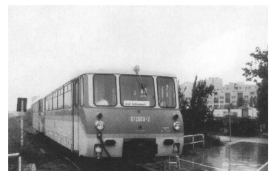
Sonderverkehr auf der Heidekrautbahn vom Märkischen Viertel nach Groß Schönebeck anlässlich der 10. Schienenverkehrs-Wochen. Schon längst könnte hier am Wilhelmsruher Damm ein provisorischer Bahnsteig stehen, von dem aus regelmäßige Fahrten in die Schorfheide angeboten werden.