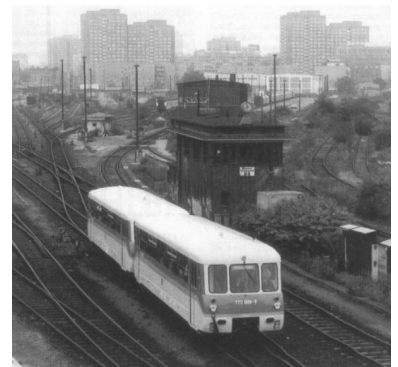
Ausfahrt aus dem Wriezener Bf. in Richtung Lichtenberg. Was hier als Sonderfahrt während der Schienenverkehrs-Wochen möglich war, soll nach den Vorstellen von PRO BAHN und IGEB schon bald wieder fahrplanmäßig erfolgen: Fern- und Regionalverkehr zum direkt neben dem Hauptbahnhof gelegenen Wriezener Bahnhof.

Daraufhin wurde eine sofortige Erweiterung des Sonderfahrtenprogramms beantragt, und ab dem 11. September konnte sonnabends auch der akut bedrohte Ast nach Liebenwalde befahren werden. Gleichzeitig intervenierte PRO BAHN bei Bahnchef Dürr gegen diese Stilllegung. Darauf folgte die Entscheidung, daß der Bahnverkehr nach Liebenwalde nicht eingestellt werden darf, bis eine Lösung für den künftigen Betrieb der Strecke gefunden ist. Der Fahrgastverband kündigte an, die Heidekrautbahn notfalls in eigener Regie zu betreiben und verwies auf seinen Selbsthilfebeschluß des Hauptverbandstages vom 18. Januar 1992.