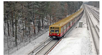
Zug der Baureihe 485 auf der S 3. Mit diesen Zügen gibt es im Winter 2012/13 die meisten Probleme. Hinzu kommen immer wieder Signal- und Weichenstörungen.