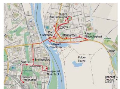
Der komplizierte Linienverlauf der neuen grenzüberschreitenden Buslinie 983. In Frankfurt bedient sie normalerweise als Endstelle den Bahnhof, nur zu den Haupt-Unizeiten Mo-Fr 9-13 Uhr endet die Linie an der Europa-Uni. In Slubice fährt sie einen Ring im Einrichtungsverkehr mit ca. 15-minütigem Aufenthalt an der Haltestelle Plac Bohaterów. (Kartengrundlage: OSM, Eintragungen: Florian Müller)