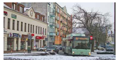
Der Bus Richtung Frankfurt Bahnhof in Slubice in der Nähe der Haltestelle Pocztka (Post). Allerdings hält der Bus hier nur in der Gegenrichtung.