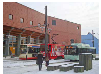
An der Endstelle Europa-Universität warten zwei Straßenbahnlinien und die neue Buslinie 983 auf die Fahrgäste.