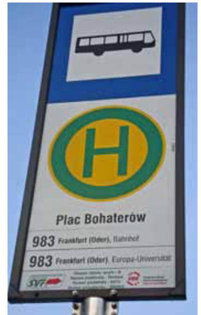
Haltestellenschild an der Endstelle in Slubice.