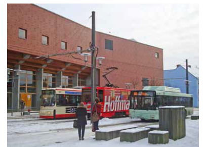
An der Endstelle Europa-Universität warten zwei Straßenbahnlinien und die neue Buslinie 983 auf die Fahrgäste.