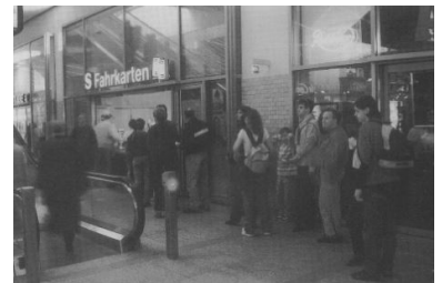
Bf Alexanderplatz: Geduldige Fahrgäste warten am Schalter.