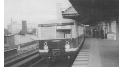
Ein 275er am 2. Juli 1990 von Potsdam Stadt (heute Potsdam Hauptbahnhof) nach Erkner im Lehrter Stadtbahnhof.