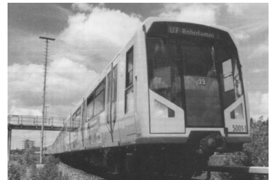
Großprofil-H-Zug der BVG. So ähnlich werden auch die HK-Züge für das U-Bahn-Kleinprofil-Netz aussehen.