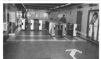
Metrostation in Madrid.