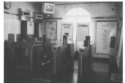
London, U-Bahn-Station South Woodford, April 2000.