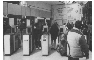
London, U-Bahn-Station Earl's Court, April 2000.