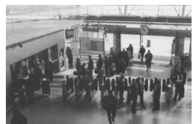
London, Haupteingang zur U- und Fernbahnstation Stratford (ein Neubau aus dem Jahre 1999). Im Bild an den Sperren zwei Assistants und an den drei Fahrkartenschaltern nochmals drei Mitarbeiter!