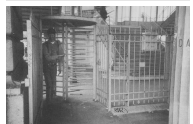
Paris, Metrostation Stalingrad, Mai 1999