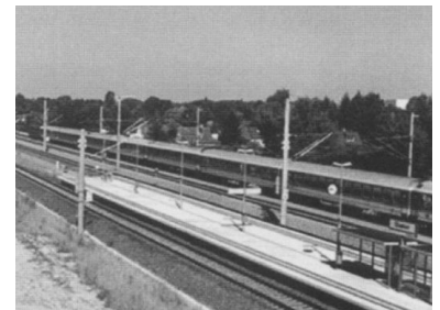
Ab 28. Mai 2000 werden auf einigen IR-Linien Fahrscheine des VBB anerkannt. Leider nicht darunter ist die IR-Linie 16 (Berlin - Hannover - Amsterdam). Weshalb wird durch komplizierte Ausnahmeregelungen das Angebots insgesamt unübersichtlich? Einfache Regelungen sind gefragt! Im Foto ein Interregio Richtung Münster am Regionalbahnhof Staaken. (Foto: Christian Schulz, August 1999)

Für den VBB-Fahrgast vom Bahnhof Zoo nach Schönefeld steht also die IR-Linie 34 Richtung Chemnitz zur Verfügung. Die Interregio-Linie Richtung Frankfurt