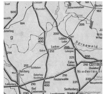
Die Niederlausitzer Eisenbahn im Südosten Brandenburgs reicht von Beeskow über Lübben Uckro, Herzberg nach Falkenberg (ehemalige Streckennummern 205 und 212). (Übersichtskarte zum DR-Kursbuch, Januar 1990.)

Schließlich wurde die Anfrage vom Mai 1999 in einem MSWV-Brief vom 8. Dezember 1999 erschöpfend beantwortet: "... Wie Ihnen bekannt ist, hat das Land Brandenburg nach gründlicher Prüfung seinerzeit den SPNV ... abbestellt. Für eine Rücknahme dieser Entscheidung besteht auch anläßlich der Landesgartenschau Luckau 2000 keine Veranlassung ..."