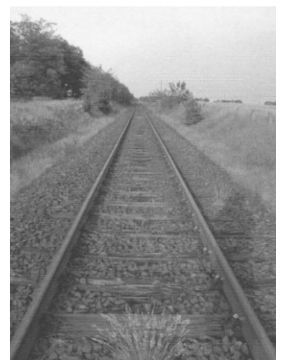
Der Abschnitt Uckro - Zöllmersdorf nach dem Umbau.