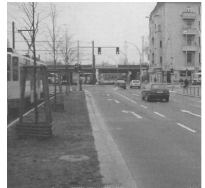
Greifswalder Straße/Grellstraße: Ranschleichen, abbremsen und anhalten. Erst folgen die Linksabbieger, ehe die Bahnen der Linien 2, 3 oder 4 die Kreuzung passieren können.