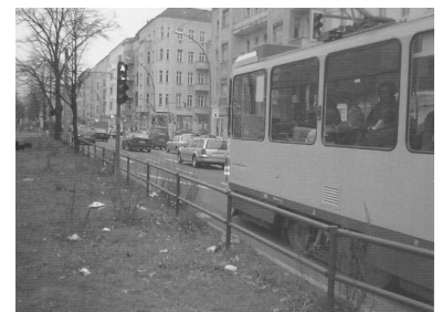
Spätestens an der Hufelandstraße heißt es dann wieder Warten für die Straßenbahn. Auch hier ist mit Bevorrechtigung nur A wie Anforderung gemeint. Vor einigen Jahren wurde an dieser Stelle die Kfz-Linksabbiegespur auf das ehemals eigene Gleisbett der Straßenbahn gelegt.