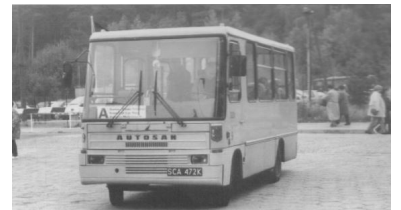
Bus in Swinemünde. (Foto: Reinhard Hübener, Oktober 1999)